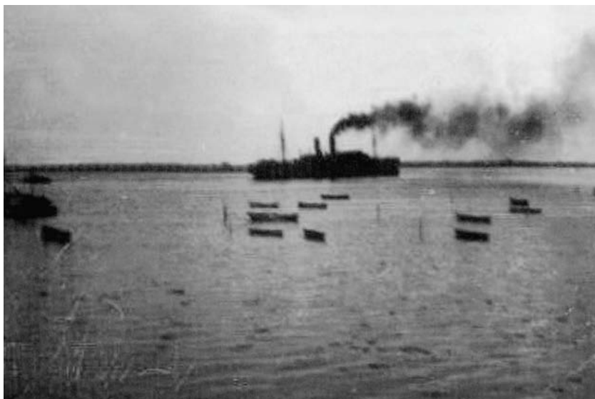
Til venstre ses MS "Oceana" som "Kraft-durch-Freude"-turistskib (fra Schön, H.2000). Ovenfor ses skibet sejle fra Hørup Hav d. 8. maj 1945 (foto: fra lokalhistorisk arkiv, Hørup sogn).

Efter kapitulationen den 5. maj var lejren, efter at minespærringerne var fjernet, klar til at modtage flygtninge. 29 Der var i alt 470 flygtninge den 11. juni 1945, som var blevet indkvarteret her, heraf 179 børn. 30 For