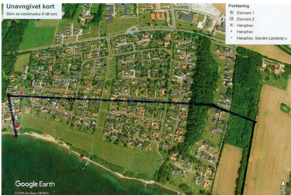
Østligste del af Høruphav med markering af den omtrentlige afgrænsning af lejrens ydre grænser.

Man skal tage i betragtning, at der ikke på noget tidspunkt var så mange mennesker i lejren, som den var bygget til. Det har utvivlsomt været med til at gøre forholdene for flygtningene i Hørup bedre end i andre lejre i Danmark, hvor forholdene var dårligere. Det har formentlig også været en væsentlig grund til, at dødeligheden, især for spædbørn, i lejren var forholdsvis lav.