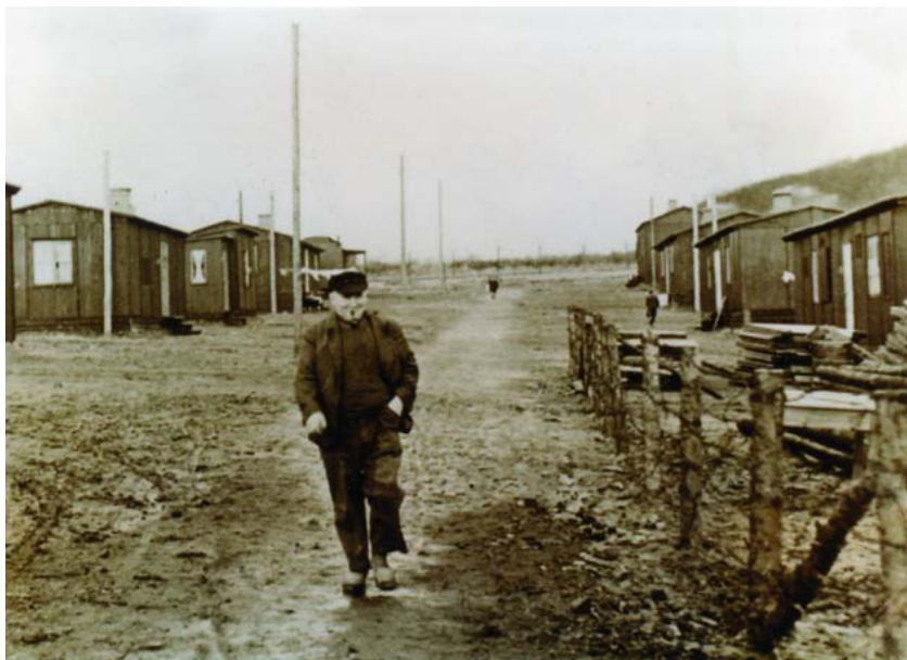
Fotos fra lejren. Første billede viser en af de store barakker med indgang midt på langsiden, og på det andet billede fås et indtryk af den triste lejrhovedgade og det smattede terræn. (Fra lokalhistorisk arkiv, Hørup sogn).