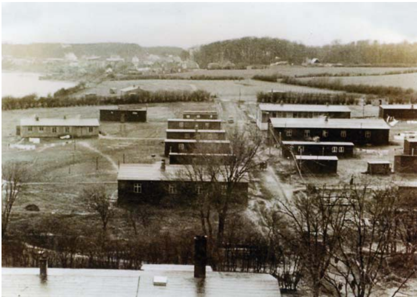
Fotos fra lejren. Første billede viser den øst-vest gående "hovedgade" mod øst med vandtårnet ragende op. Det andet billede ser mod vest og er fotograferet fra vandtårnet med lidt af Hørup Hav og længere bagude huse i Høruphav samt Præsteskov.