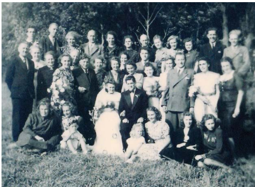
Bryllupsselskabet i lejren, august 1947.

tilfaldt sundhedspersonalet som f. eks. udgangstilladelser, der blev udnyttet til cykelture til Sønderborg, hvor bekendte fra opholdet her forsynede hende med cigaretter, kaffe og andre forbrugsgoder. Hun passerede ved hjemkomsten uhindret lejrvagten, der vendte det blinde øje til. I.-L. husker tydeligt tyfusepidemien i efteråret 1945, f.eks. når vagtmandskabet blev kaldt til en plaget patient, der dog ofte modtog dem med et "Schon zu spät" – tarmen havde tømt sig. Efter nattevagterne stod der hver morgen frisk kaffe, rundstykke og cigaretter til vagtholdet. Moderen arbejdede som skrædder og syerske i et lokale i deres barak. Hun var opfindsom, syede således en kasseret hvid natkjole om til en smuk brudekjole til et bryllup i august 1947. Også lejrens teater- og dansegrupper udstyrede hun med flotte dragter. Der blev arrangeret baller i teatersalen, men kl. 22 blev alt lys slukket og de deltagende måtte finde hjem. Hvis nogen herefter befandt sig i terrænet, blev de afsløret af en lyskasters vandrende lyskegle. Under lejropholdet udviklede I.-L. et tæt forhold til én af de patruljerende CB-vagter. Efter at være blevet repatrieret i september 1947, hvor lejren stort set var tømt, tog hun og moderen ophold hos familie i Østberlin, og senere i Flensborg. Herfra hentede